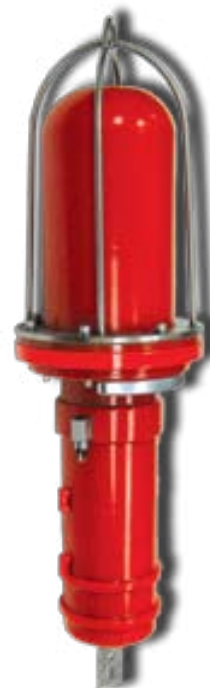
Le WESMAR Web850 est un équipement léger, pour une protection effective et nécessitant peu d'opérateurs pour configurer et deployer.